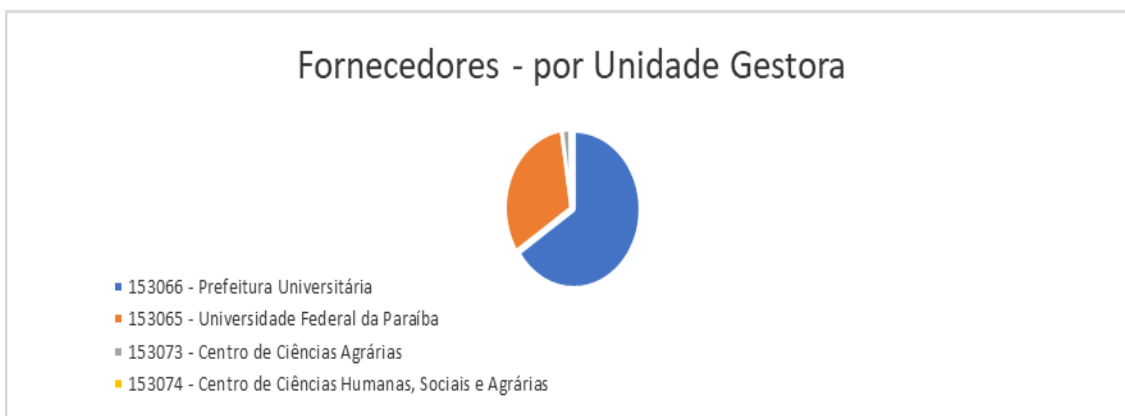
Gráfico 03 – Fornecedores por Unidade Gestora

A unidade gestora 153066 é responsável por 65,65% do total de Fornecedores e Contas a Pagar.